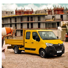
Plató - duplakabin