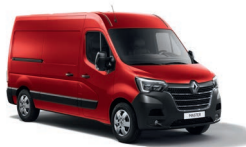
Furgon - hátsókerék-hajtás