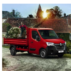
Plató - szimplakabin