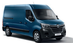
Furgon - elsőkerék-hajtás