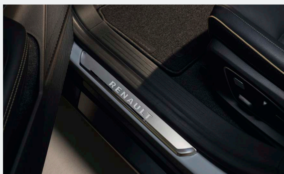
226 990 Ft

4 A feltüntetett árak az RN Hungary Kft. ajánlott árai, a tartozékok és tartozék csomagok beszerelési munkadíjáról érdeklődjön a Renault márkakereskedésekben!