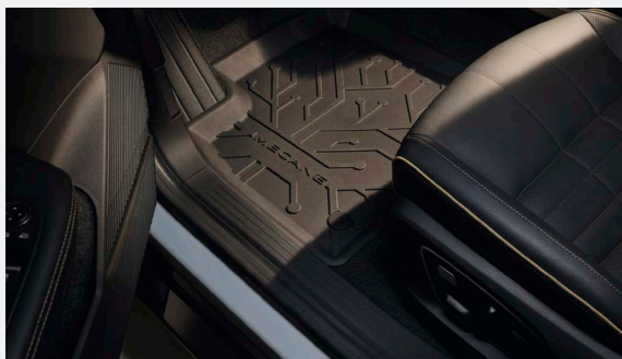
4 db-os gumi- vagy textilszőnyeg szett 24 890 Ft