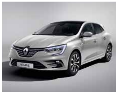
Highland szürke (2)