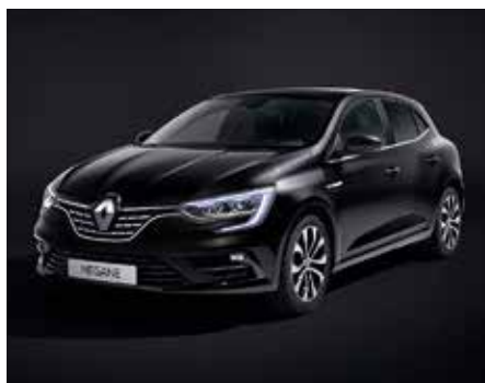
Fekete gyémánt (2)