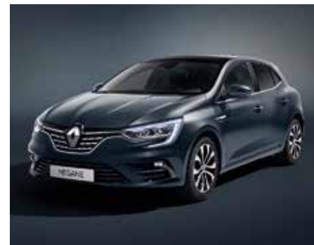
Titánium szürke (2)