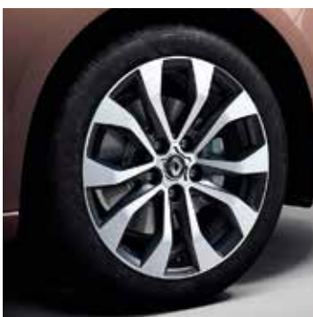
17" Diamond Emotion könnyűfém tárcsa