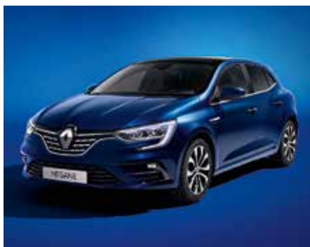
Kozmosz kék (2)