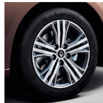
16" Diamond Impulse könnyűfém tárcsa