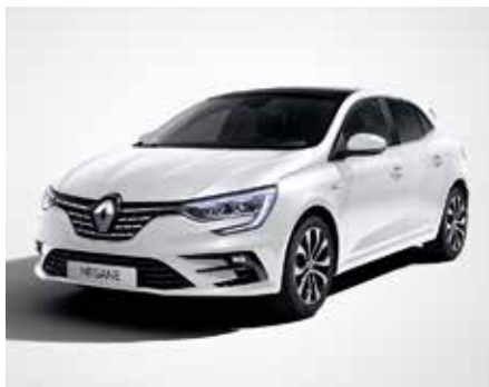
Gyöngyház fehér (2)