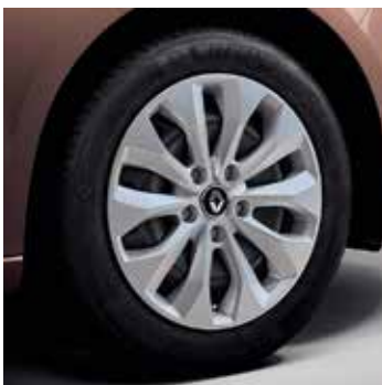
16" acélfelni Florida dísz tárcsával