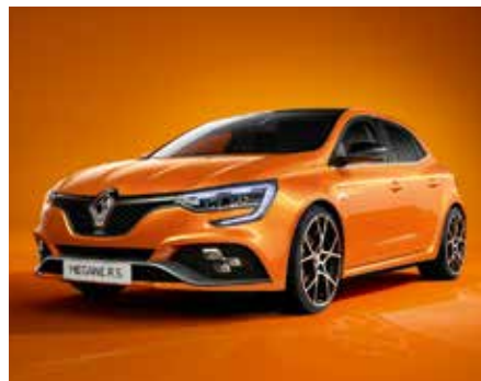
Pezsgő narancs (3)