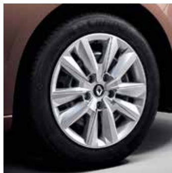
16" acélfelni Eclipse dísz tárcsával