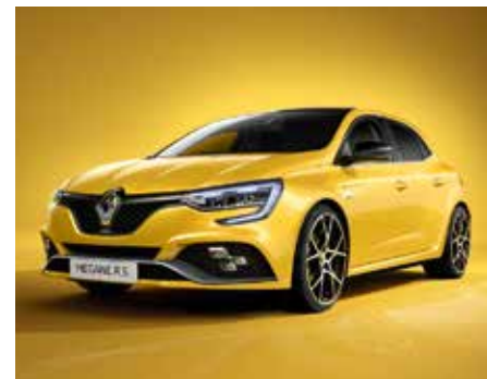
Sírius sárga (3)

(1) Nem metál fényezés. (2) Metálfényezés. (3) Speciális R.S. metálfényezés. A valós színek eltérhetnek a fotóképtől.