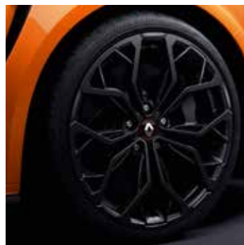
19" Interlagos fényes fekete könnyűfém tárcsa