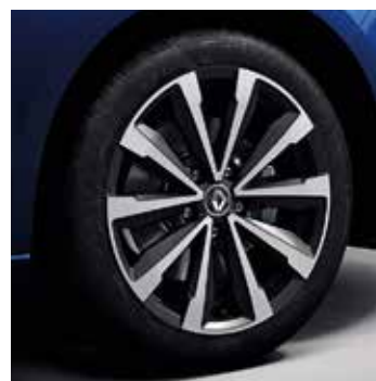
17" Diamond Passion könnyűfém tárcsa