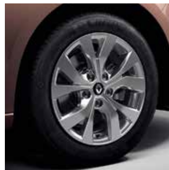
16" Celsius könnyűfém tárcsa