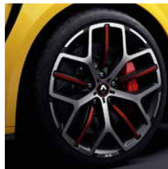
19" Akio könnyűfém tárcsa