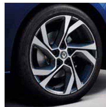
18" Diamond Dynamic könnyűfém tárcsa