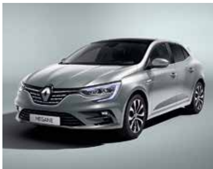
Balti szürke (2)