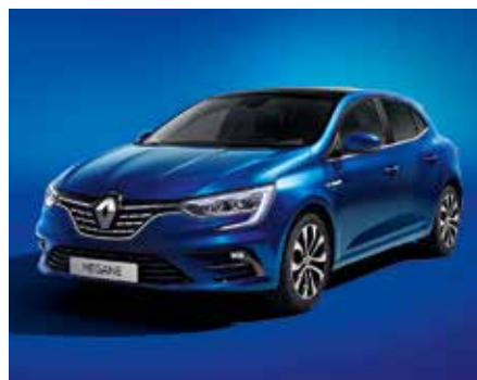
Ferrit kék (2)