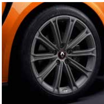
18" Estoril könnyűfém tárcsa