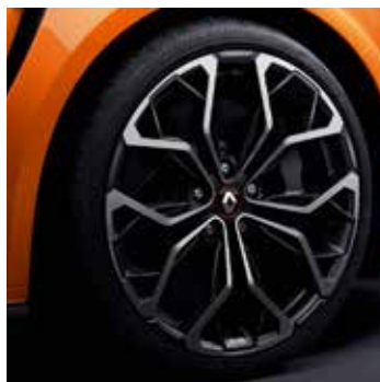
19" Interlagos ezüst-fekete könnyűfém tárcsa