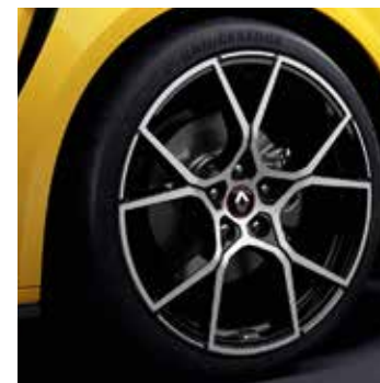
19" Fuji könnyűfém tárcsa