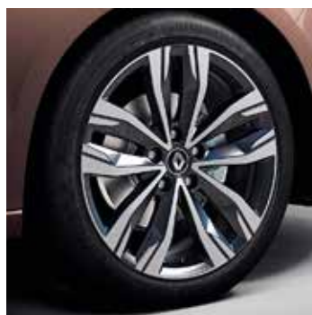
18" Diamond Hightech könnyűfém tárcsa